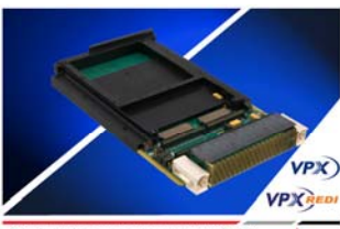
Curtiss-Wright Announces New VPX3-127 Rugged 3U VPX Single Board Computer

Одноплатный компьютер VPX3-127 выполнен в формате VPX 3U и содержит: