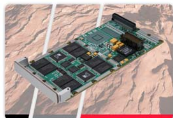
Curtiss-Wright's New XMC-550 Rugged 32 Gbyte NAND Flash Solid State Drive XMC/PMC Card

Модуль флэш-накопителя ХМС-550 выполнен в мезонинном формате ХМС (VITA 42) и выпускается в конфигурациях на 8, 16 и 32 ГБайт. С точки зрения программного обеспечения модуль выглядит как два независимых SATA-диска со скоростью считывания 30Мбайт/сек, а с поддержкой RAID0 – до 50Мбайт/сек. Интерфейс с платой носителем – x1 PCIe или PCI 32бит/66МГц. Поддерживается стандартная для NAND-флэш коррекция ошибок, позволяющая исправлять до 8 случайных однобитовых ошибок на 512-байтовый сектор. Модуль имеет аппаратную защиту от записи.