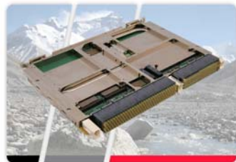
Curtiss-Wright Announces VPX6-1952, New Intel® Core™2 Duo processor T9400-based 6U VPX Single Board Computer

Одноплатный компьютер VPX6-1952, разработанный для программы FCS (Future Combat Systems) армии США, выполнен в формате 6U VPX (стандарт VITA 46) и содержит: